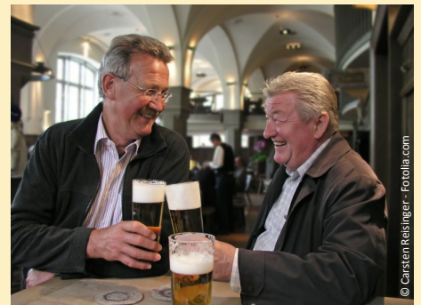
Fest sitzende Zähne: Ein gutes Gefühl!

Stellen Sie sich vor, wie es ist, wenn Sie wieder kraftvoll abbeißen und gut kauen können. Freuen Sie sich an Ihrer neu gewonnenen Sicherheit im Umgang mit anderen Menschen.