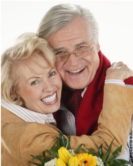
Mehr Lebensfreude und Sicherheit mit Implantaten