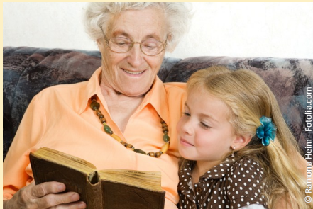
Sicher und unbefangen sprechen mit gut sitzenden Zähnen

Menschen jeden Alters wollen heutzutage aktiv am Leben teilnehmen: In ihrer Familie, im Freundeskreis und bei gesellschaftlichen Anlässen. Dazu gehört auch, dass man sich sicher fühlt beim Essen, Reden und Lachen.