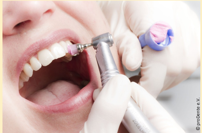
Die Professionelle Zahnreinigung wird von speziell ausgebildeten Prophylaxe-Fachkräften ausgeführt und ist eine lohnende Investition in die eigene Gesundheit.

Sie ersparen sich oft Kronen, Implantate und Zahnfleischoperationen.“